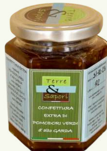
Confettura Extra di Pomodori Verdi Vasetto in vetro gr. 200