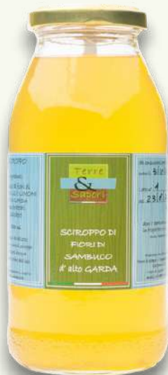
Fiori di Sambuco