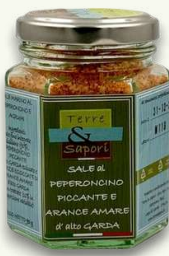
Sale al Peperoncino e Arance Amare Vasetto in vetro gr. 90