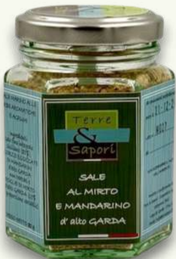
Sale al Mirto e Mandarino Vasetto in vetro gr. 80