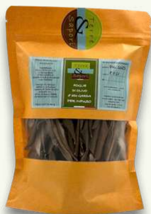
Infuso Foglie di Olivo Sacchetto gr. 40