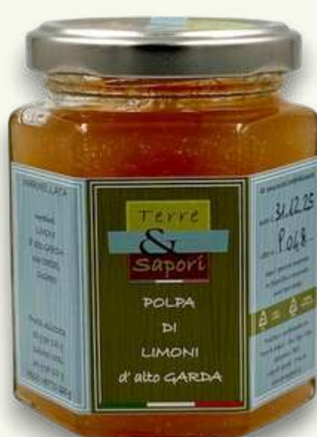
Polpa di Limoni