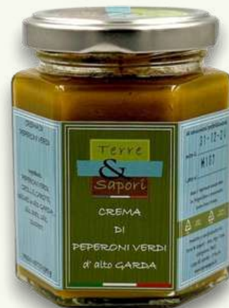
Crema di Peperoni Verdi Vasetto in vetro gr. 180