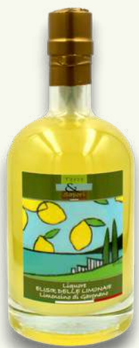
Limoncino Bottiglia ml 500

Da servire freschi ma non ghiacciati, per assaporare al meglio il loro gusto naturale e ben bilanciato per un fine pasto digestivo o alla base di originali spritz come aperitivo locale.