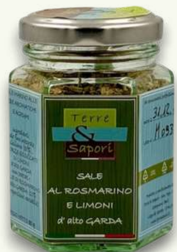
Sale al Rosmarino e Limoni Vasetto in vetro gr. 80