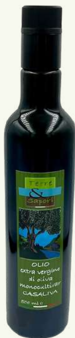
Casaliva Bottiglia ml 500

Si ottiene così un olio molto più ricco di polifenoli e sostanze benefiche: un olio che non è solo buono, ma soprattutto è un olio salutare.