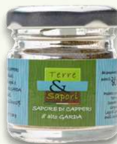
Sapore di Capperi Vasetto in vetro gr. 20

La linea dei capperi è preziosa e prodotta in quantità limitata. La loro disponibilità è legata agli andamenti stagionali in agricoltura e in natura.