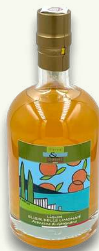
Arancino Bottiglia ml 500