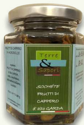
Frutti di Cappero Vasetto in vetro gr. 130