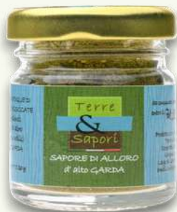
Sapore di Alloro Vasetto gr. 20