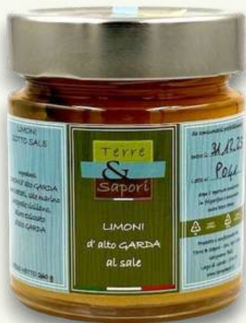
Limoni al Sale Vasetto in vetro gr. 260

Produciamo anche composte da orticole conferite dai soci per ottenere creme spalmabili o composte da utilizzare per gli aperitivi o in abbinamento ad altre pietanze.