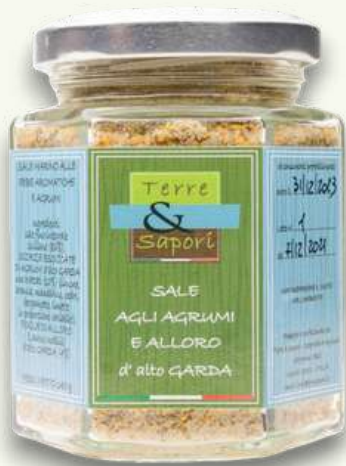
Sale agli Agrumi e Alloro Vasetto in vetro gr. 80