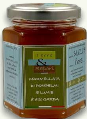
Pompelmi e Lumie