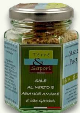
Sale al Mirto e Arance Amare Vasetto in vetro gr. 80