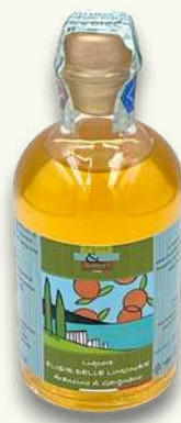
Arancino Bottiglia ml 100