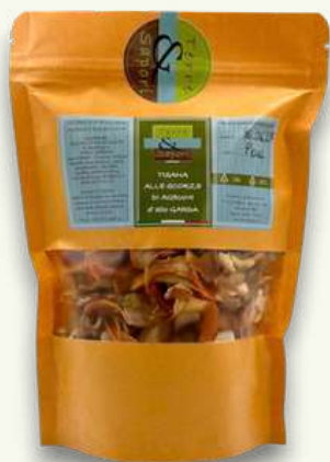
Tisana alle Scorze di Agrumi Sacchetto gr. 50

Completano il nostro catalogo delle foglie essiccate di olivo e di alloro per infusi, tisane a base di erbe aromatiche e agrumi, oltre allo zafferano del Montegargnano.