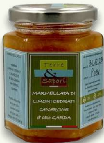
Limoni Cedrati Canarone