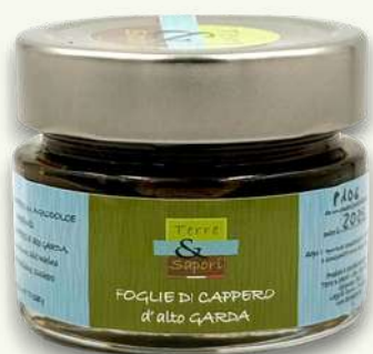
Foglie di Cappero Vasetto in vetro gr. 125