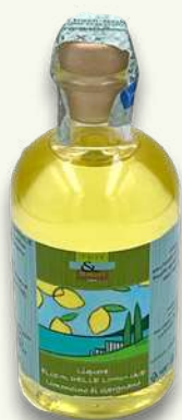
Limoncino Bottiglia ml 100