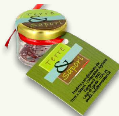
Zafferano Vasetto gr. 0,15