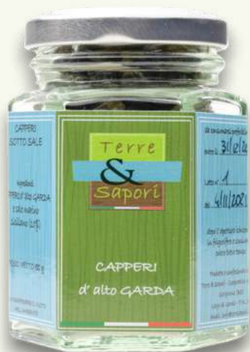
Capperi Vasetto in vetro gr. 50