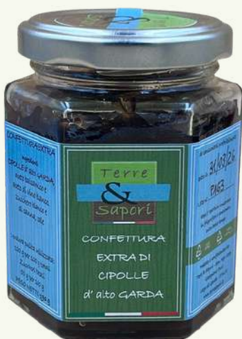
Confettura Extra di Cipolle Vasetto in vetro gr. 190