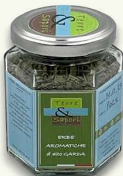
Erbe Aromatiche Miste Vasetto gr. 30