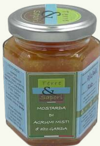
Agrumi Misti Vasetto in vetro gr. 200

Abbinatela ai formaggi o ai bolliti ed avrete un connubio armonioso ed esaltante.