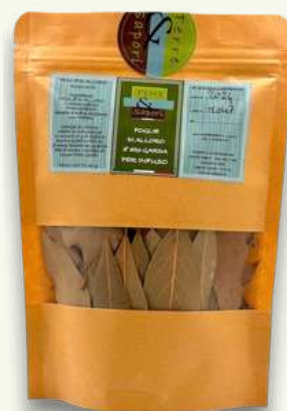
Infuso Foglie di Alloro Sacchetto gr. 40