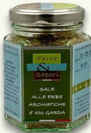
Sale alle Erbe Aromatiche Vasetto in vetro gr. 80